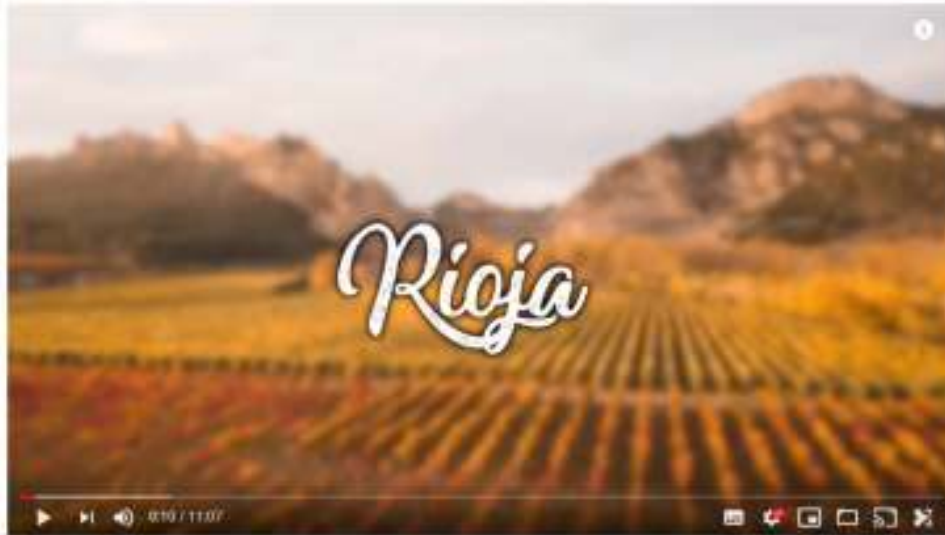
RIOJA La región del vino en cuevas

Desde la incorporación de Carlos Sarralde , Guías Viajar realiza vídeos con un moderno estilo de realización, enfocados a su publicación en YouTube y otras redes sociales